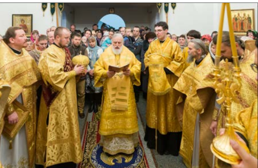
На фото: За Божественной литургией. Храм в честь Святителя Николая Чудотворца города Минска, 19 декабря 2014 г.