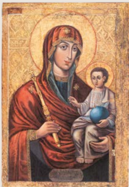
Икона Божией Матери «Минская» 13/26 АВГУСТА Тропарь, глас 6:

Издается по благословению Высокопреосвященнейшего ПЛАВА, Митрополита Минского и Заславского, Патриаршего Экзарха всея Беларуси