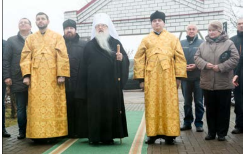
На фото: За Литургией в храме в честь Святителя Николая Чудотворца. Поселок Привольный Минского района, 19 декабря 2014 г.