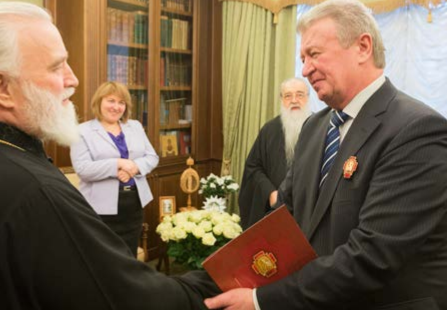
На фото: Награждение Первого заместителя Главы адми- нистрации Президента Республики Беларусь А. М. Радькова орденом святителя Кирилла Туров- ского I степени. Минское епархиальное управление, 15 декабря 2014 г.

назидания, поздравил причастников с принятием Святых Христовых Таин и преподал всем архипастырское благословение.