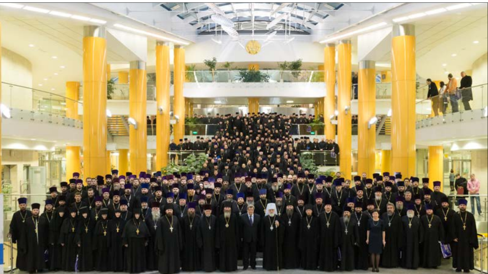
На фото внизу: Участники Общего собрания епархий Минской митрополии Белорусской Православной Церкви. Национальная библиотека Беларуси, Минск, 16 декабря 2014 г.