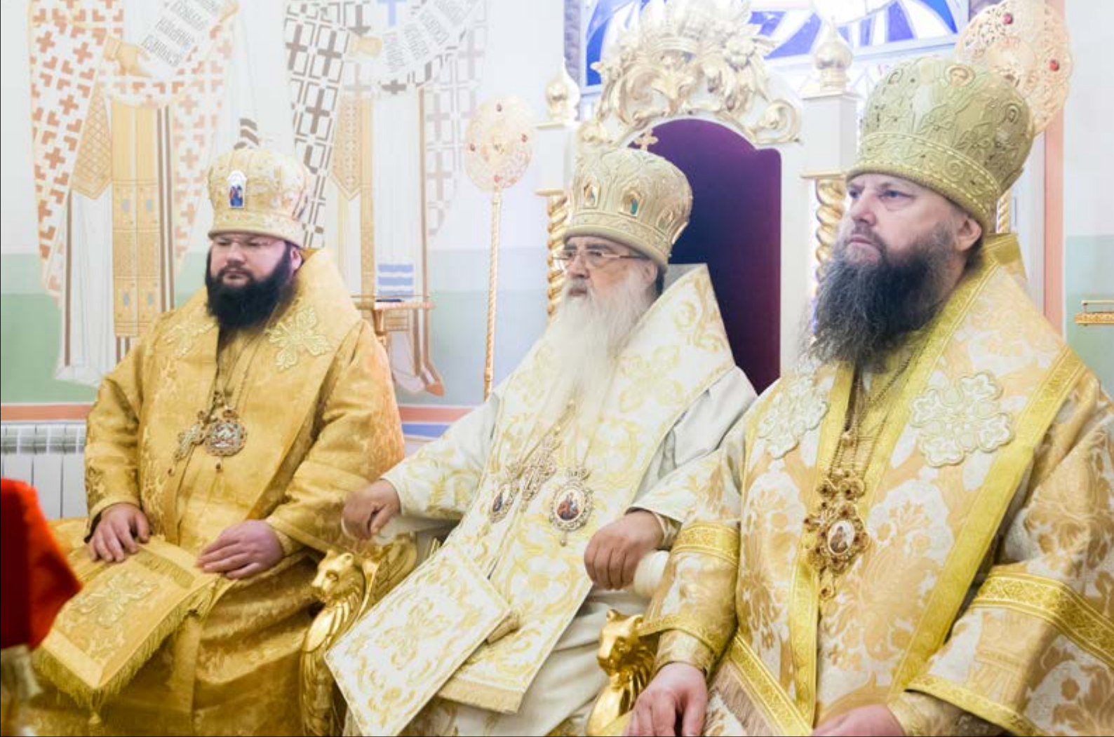
На фото: За Божественной литургией. Домовый храм Минского епархиального управления в честь Собора Белорусских святых, Минск, 24 октября 2014 г.