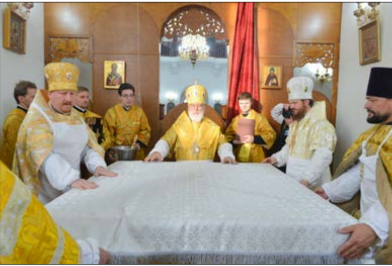
На фото: Освящение Воскресенского кафедрального собора. Город Борисов, 19 октября 2014 г.