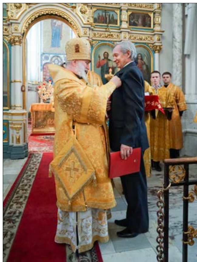
На фото: Вручение церковных наград потрудившимся во славу Святой Православной Церкви. Свято-Духов кафедральный собор города Минска, 18 ноября 2014 г.