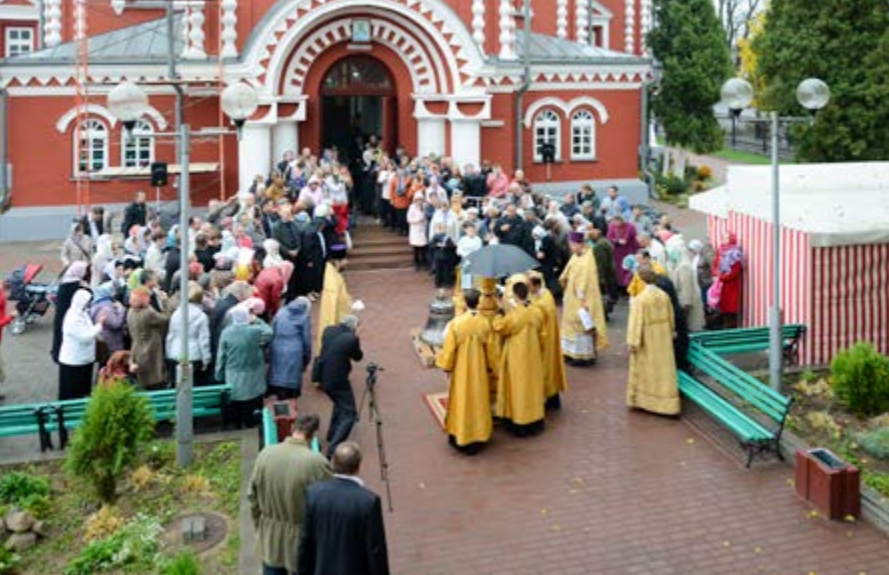
На фото: Освящение колокола для Воскресенского кафедрального собора города Борисова. 12 октября 2014 г.