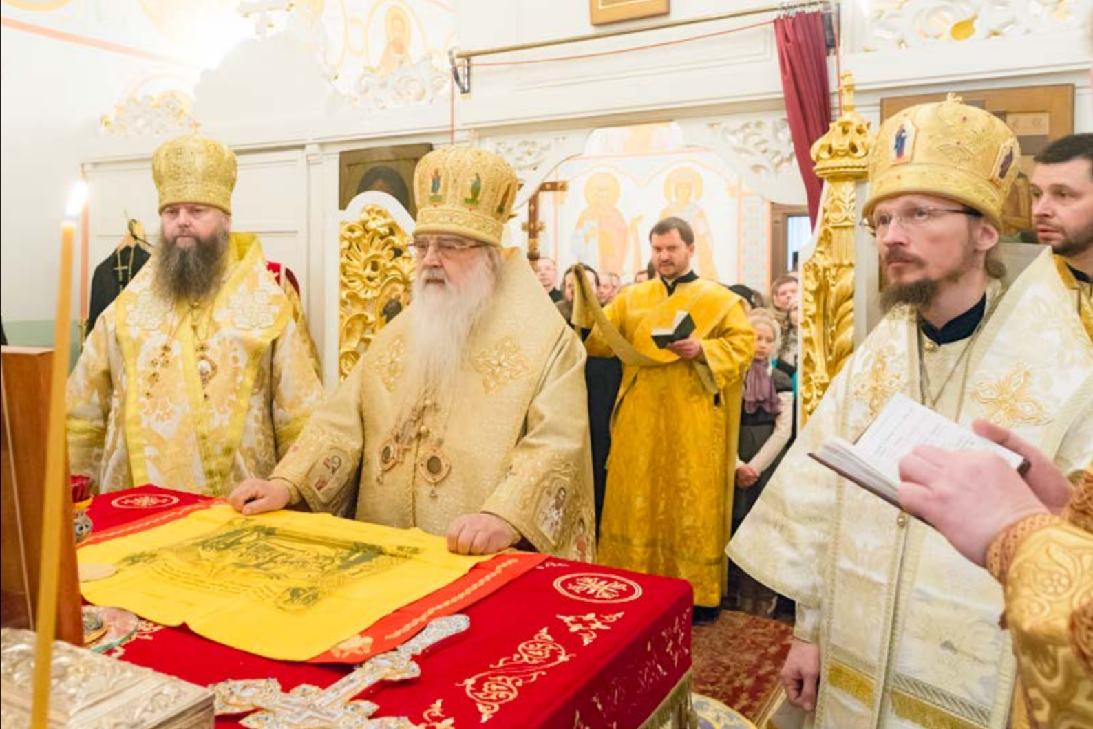
На фото: За Божественной литургией. Домовый храм Минского епархиального управления в честь Собора Белорусских святых, Минск, 14 декабря 2014 г.