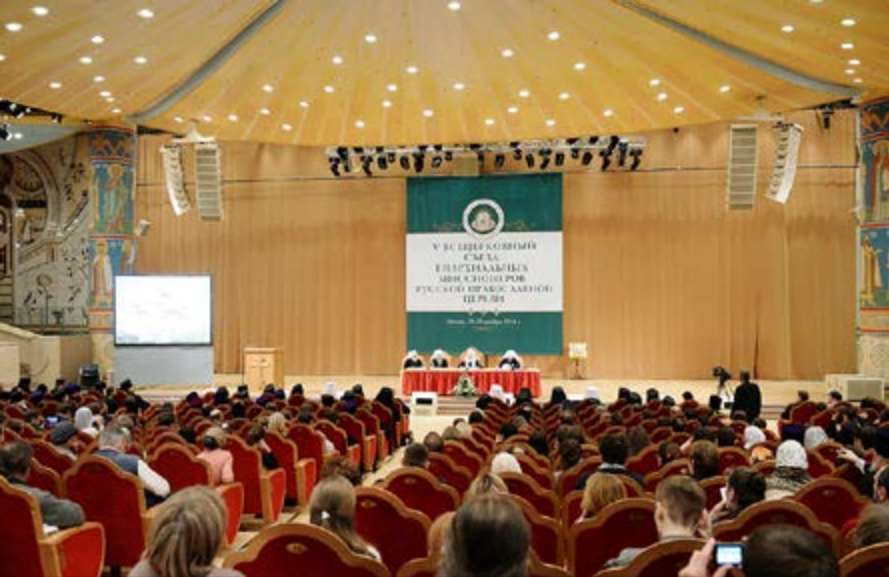
На фото: V Всецерковный съезд епархиальных миссионеров РПЦ, Зал церковных соборов Храма Христа Спасителя, Москва, 23 ноября 2014 г.