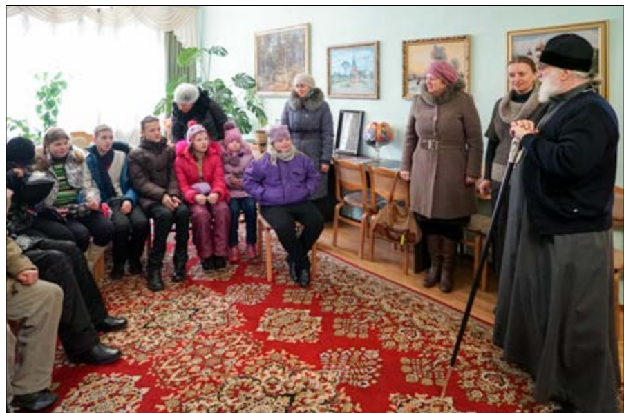
На фото: Визит митрополита Минского и Заславского Павла во вновь образованную Слуцкую и Солигорскую епархию. 21 ноября 2014 г.