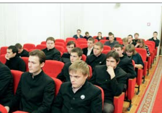
С 6 по 8 ноября 2014 года на базе Минской духовной семинарии прошел VII научно-практический семинар