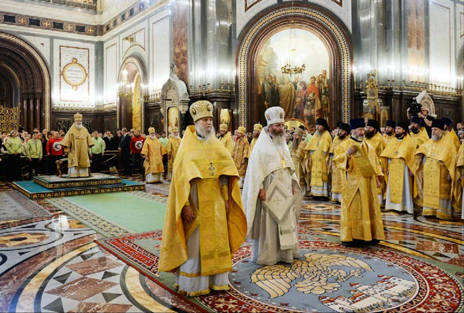
На фото сверху: За Божественной литургией в Кафедральном Соборном Храме Христа Спасителя. Москва, 2 декабря 2014 г.