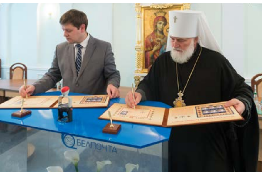
На фото: Во время церемонии, посвященной выпуску почтовой марки «25 лет со времени создания Белорусского Экзархата». Минское епархиальное управление, 11 октября 2014 г.