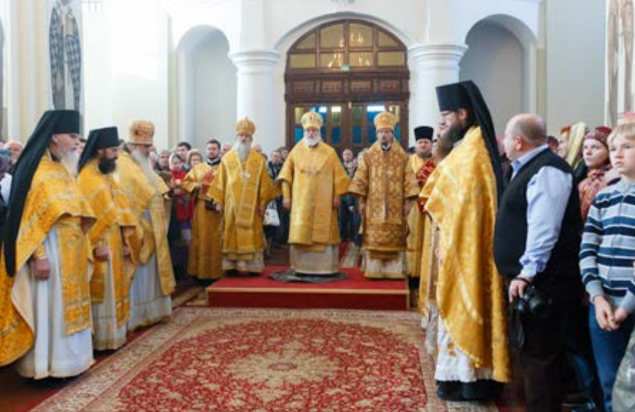
На фото: За Литургией в Благо- вещенском мужском монастыре. Деревня Малые Ляды, Смолевичский район, 5 октября 2014 г.

наше не готово к восприятию Божественного дара. Нас часто обременяют земные заботы и страсти. Чтобы приблизиться к благодати Божией, мы должны подготовить свое сердце. Готовясь к встрече дорогих гостей, мы приводим в порядок жилище, готовим вкусные яства. То же самое должно происходить и перед нашей встречей с Богом в храме. Нам нужно подготовить жилище сердца своего посредством Таинства Покаяния. Совершение добрых дел будет нашим приготовлением вкусных яств для Господа. Мы должны украсить сердце свое делами добра, любви и милосердия. Наша любовь к Богу должна проявляться через любовь к ближнему. Если мы не всегда можем помочь ближнему материально, то помочь добрым словом, молитвой и состраданием можно всегда.