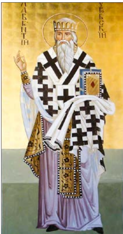
Свяціцель Лаўрэнцій Тураўскі. Роспіс храма Раждства Прысвятой Багародзіцы у сяле Тарасав Мінскага раёна. Майстэрня IKONIQUE. XXI век

Для ўстанаўлення парадку кананізацый на епархіяльным