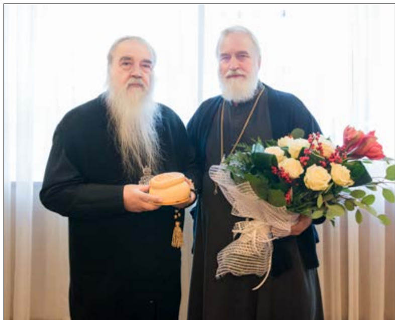
На фото: Поздравление митрополита Филарета, почетного Патриаршего Экзарха всея Беларуси, с днем Ангела. Минское епархиальное управление, 14–15 декабря 2014 г.