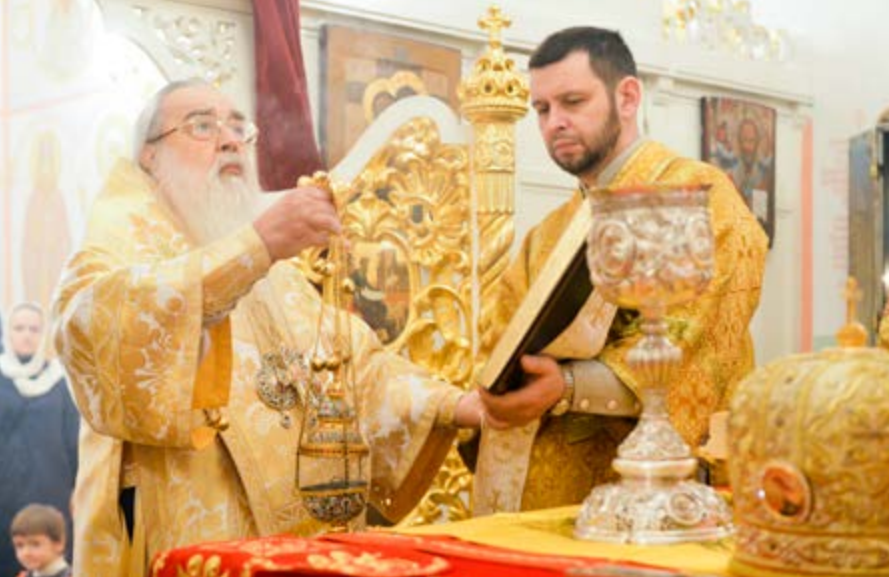
На фото: За Литургией. Домовый храм Минского епархиального управления в честь Собора Белорусских святых, Минск, 7 декабря 2014 г.

Литургические песнопения исполнил хор под управлением Анастасии Тимофеевой.