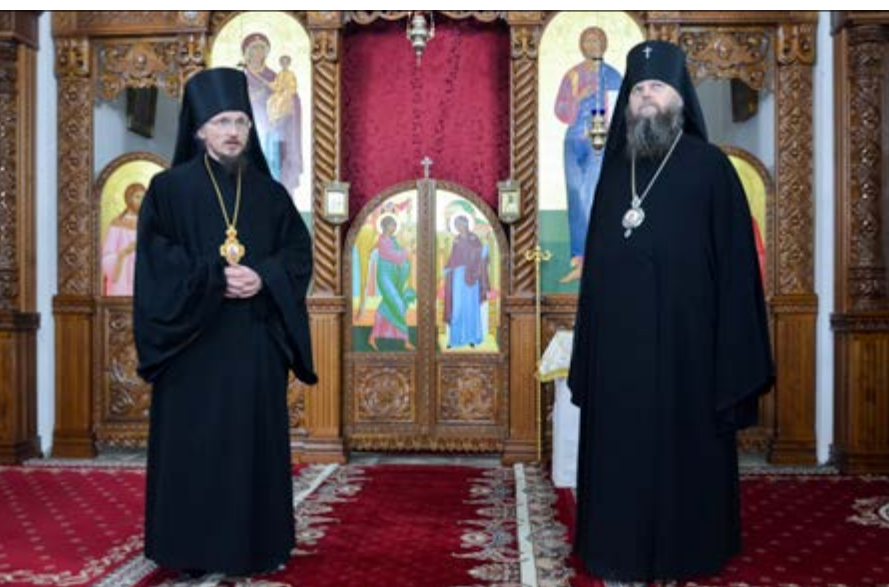
На фото: В Воскресенском кафедральном соборе города Борисова. 18 октября 2014 г.

После сугубой ектении архиастырь вознес молитву о мире и преодолении междоусобной брани в Украине.