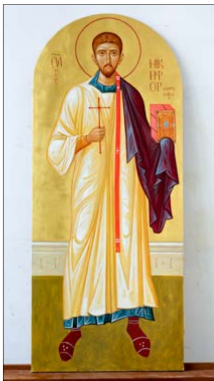
Свяшчэннамучанік архідыякан Нікіфар (Кантакузен). Ікона для іканастаса. Праца Андрэя Косікава. XXI век

У 2004 годзе у храме у гонар Свяціцеля Мікалая горада Петрыкава адбылося праслаўленне свяшчэннамучаніка Іаана (Пашына), ураджэнца тых месцаў, які ў сане вікарнага епіскапа