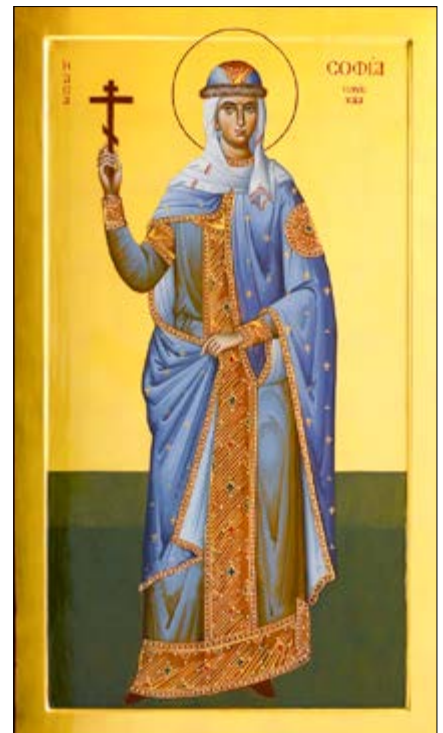
Праведная Сафія, княгіня Слуткая. Мерная ікона. Майстэрня IKONIQUE. XXI век

вылучаны 23 імёны тых, хто з асаблівым змірэннем, цвёрдасцю духа сустрэў выпрабаванні, прыняўшы пакутніцкую смерць за Госпада. На пасяджэнні