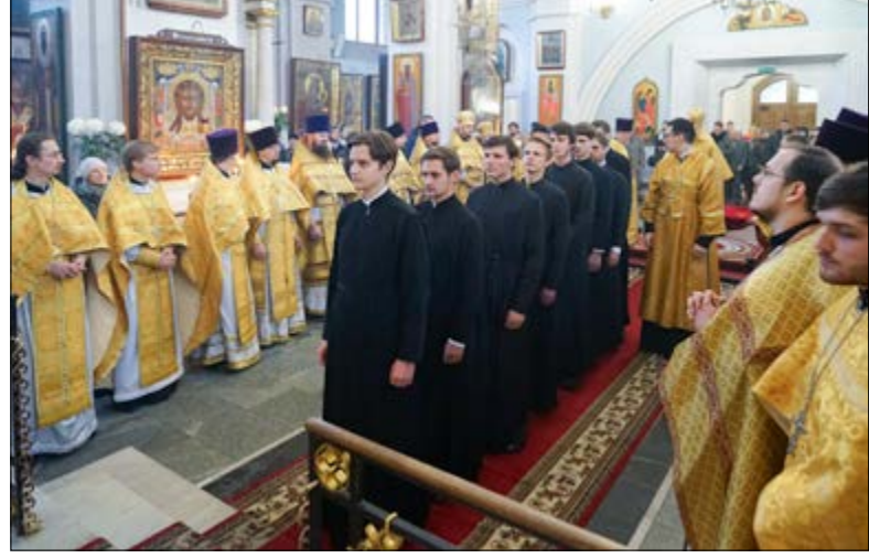
На фото: Торжества по случаю празднования 10-летия Института теологии Белорусского государственного университета. Свято-Духов кафедральный собор города Минска, 18 ноября 2014 г.