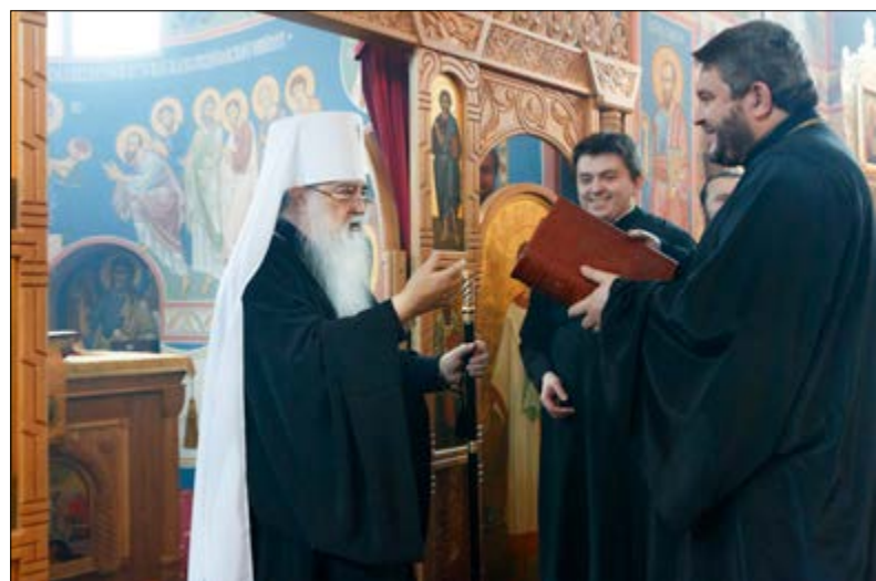
На фото внизу: Архипастырское благословение по окончании богослужения. Поселок Привольный Минского района, 19 декабря 2014 г.