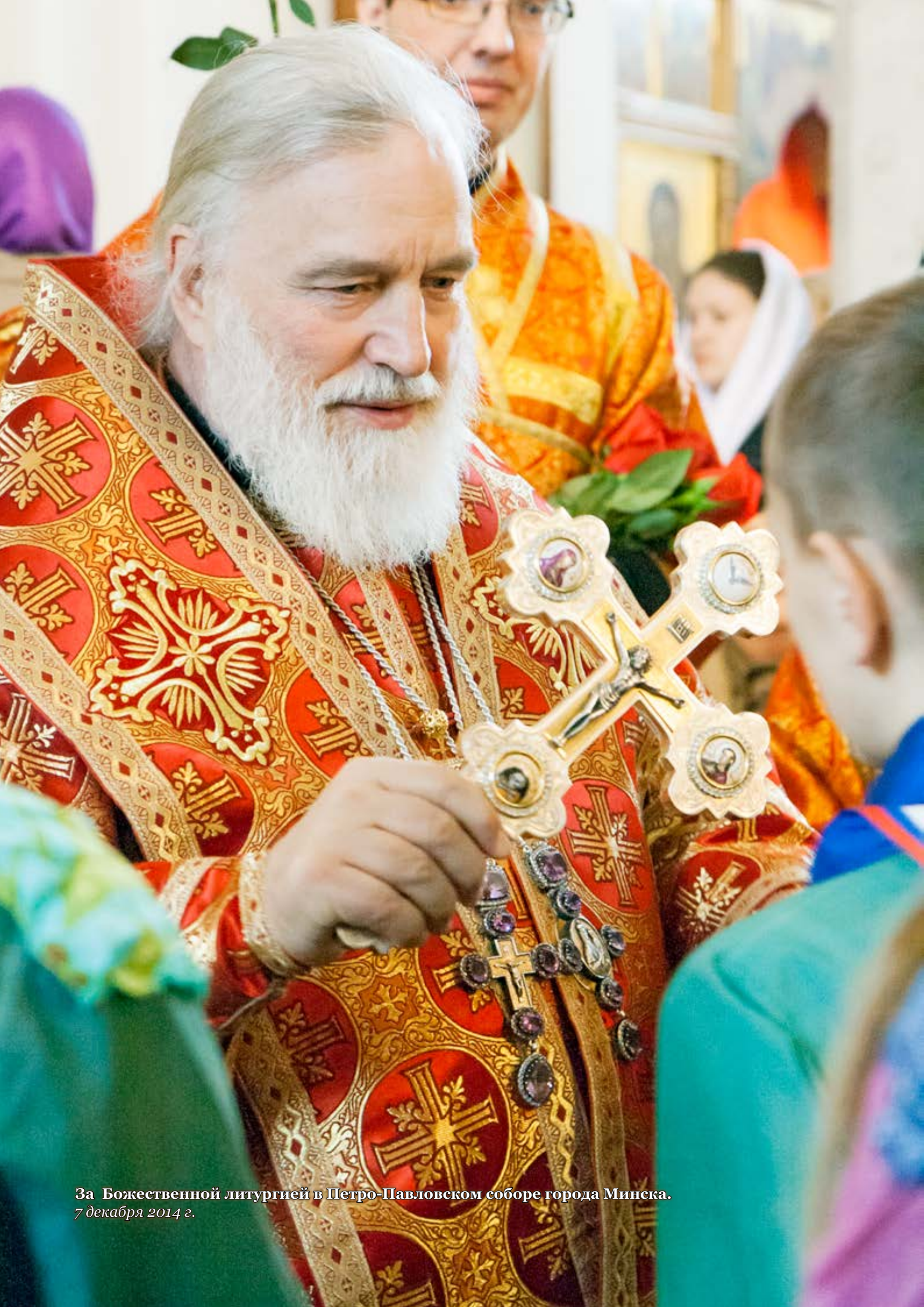
За Божественной литургией в Петро-Павловском соборе города Минска. 7 декабря 2014 г.