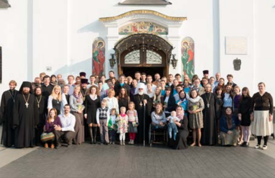
На фото: У Свято-Духова кафедрального собора города Минска.