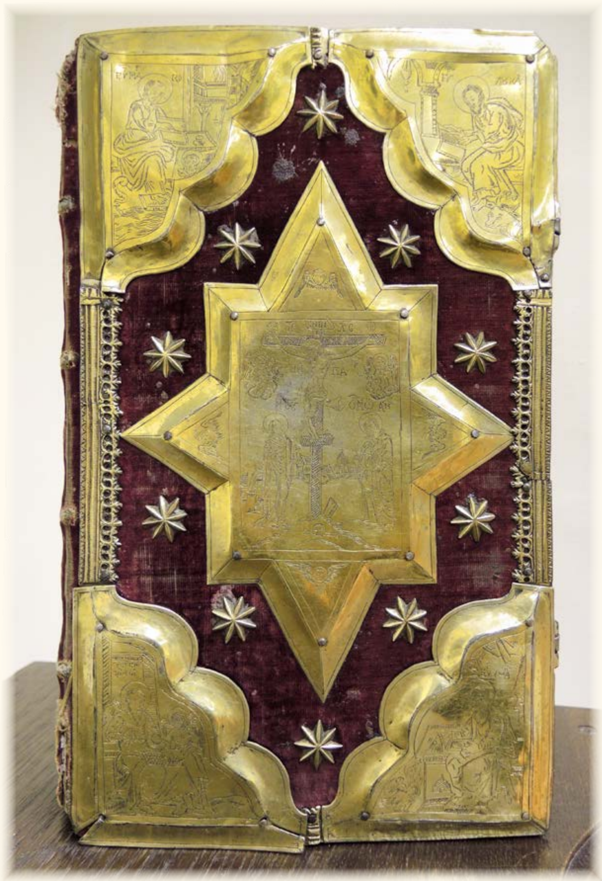
Евангелие Бытеньского монастыря