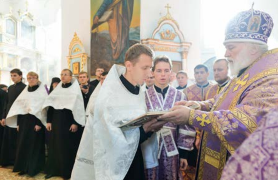
На фото: Чин поставления во чтецов студентов МинДАиС. Успенский собор Жировичского монастыря, 2 октября 2014 г.

нию владыки Экзарха, это совпадение не случайно. Сегодня взоры православных христиан обращены ко Кресту, на котором был распят Христос. «Крест Христов является основанием и славой Церкви. Взирая на распятого Христа, мы должны учиться Его Божественной любви к людям, — сказал митрополит Павел. — Именно этот пример Божественной любви к человеку должен стать, насколько возможно, основным качеством каждого пастыря. Мы должны помнить, что все наши трудности и печали — ничто по сравнению с тем, что претерпел на Кресте Господь наш Иисус Христос. Спаситель показал нам пример доброго пастыря, Который отдал всего Себя ради человека. Каждый священник обязан всегда помнить об этом, потому что священство — это не работа, а подвиг самоотверженного служения Богу через служение людям».