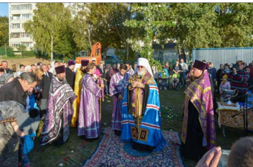
На фото: Освящение поклонного креста на месте строительства храма в честь святителя Луки Крымского. Город Минск, 3 октября 2014 г.