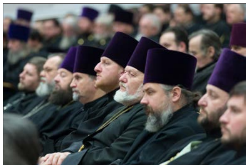
На фото: Во время Общего собрания епархий Минской митрополии. Конференц-зал Национальной библиотеки Беларуси, Минск, 16 декабря 2014 г.