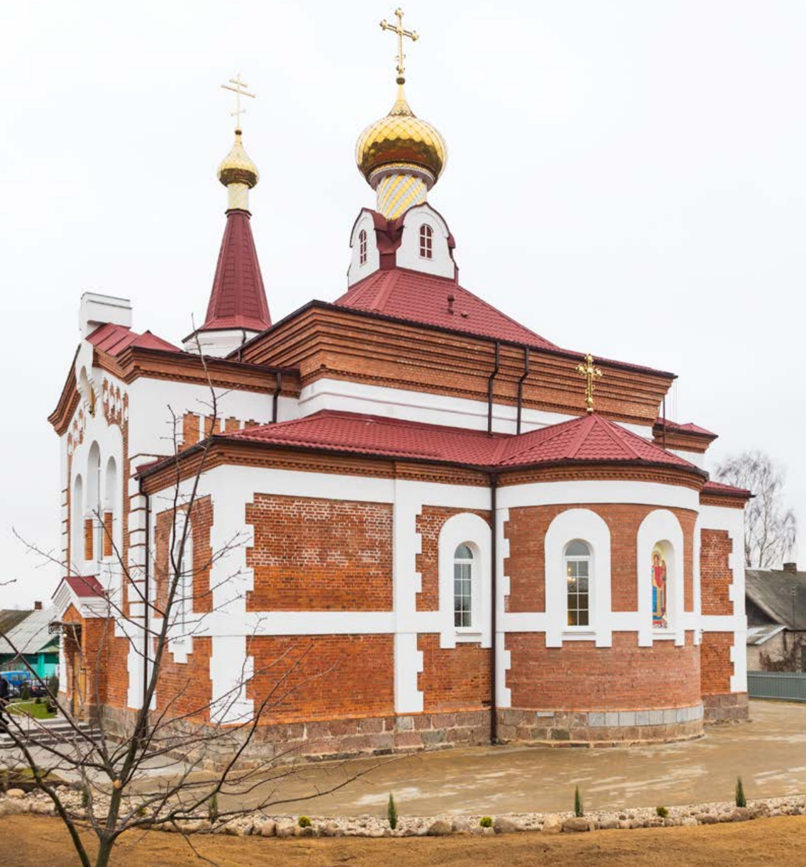
Храм в честь Архангела Михаила в деревне Зембин Борисовского района Минской области. Освящен 16 ноября 2014 года Его Высокопреосвященством Митрополитом Минским и Заславским, Патриаршим Экзархом всея Беларуси Павлом