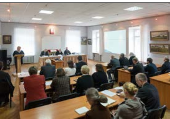
16 октября 2014 года в здании Института теологии БГУ состоялось расширенное заседание Ученого совета