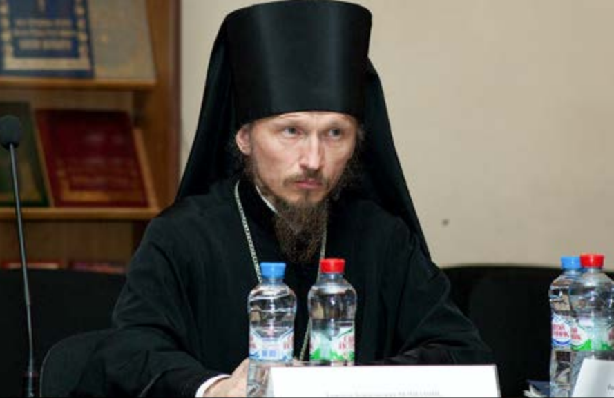
На фото: Во время заседания общего собрания членов Издательского совета РПЦ. 21 октября 2014 г.