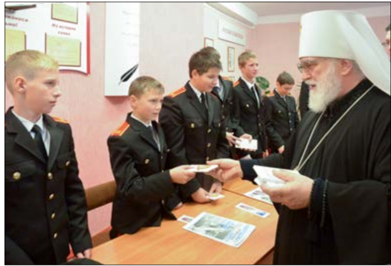
Архипастырский визит Патриаршего Экзарха в Новогрудскую епархию. 4–5 ноября 2014 г.