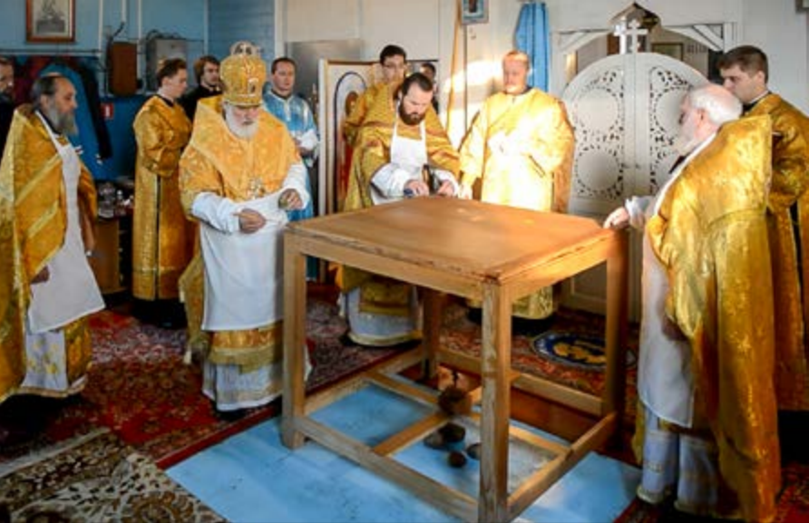
На фото: Освящение храма Рождества Пресвятой Богородицы в селе Дуброво Молодечненского района Минской области. 11 октября 2014 г.

которое стало первым столь представительным форумом наместников, игуменов и игумений за прошедшую четверть века, с начала возрождения монастырей и монашеской жизни в России.