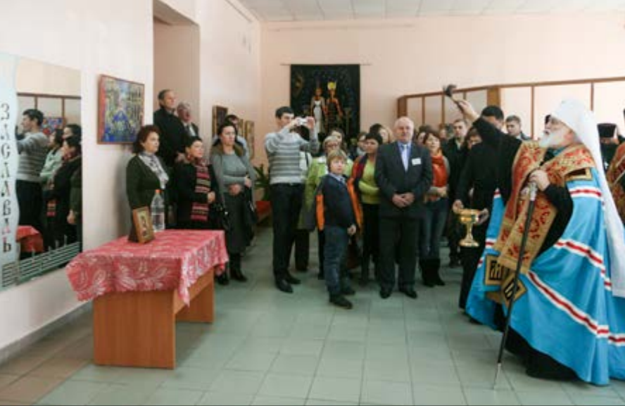
На фото: Освящение детской школы искусств города Заславля.