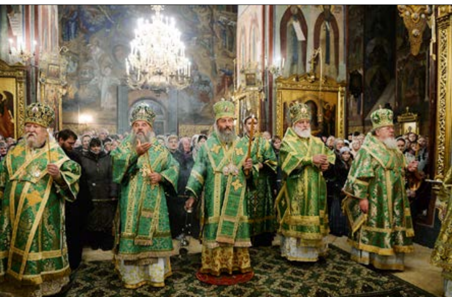
На фото: За всенощным бдением в Успенском соборе Свято- Троицкой Сергиевой Лавры. Сергиев Посад Московской области, 7 октября 2014 г.

лай преподнес Его Высокопреосвященству картину с изображением храма.