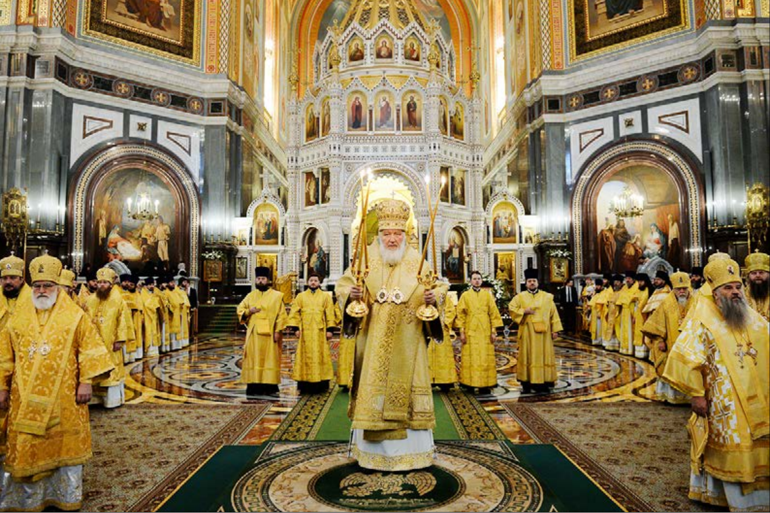
На фото: За Божественной литургией в Кафедральном Соборном Храме Христа Спасителя; хиротония архимандрита Павла (Тимофеевского) во епископа Молодечненского и Столбцовского (слева внизу). Город Москва, 2 декабря 2014 г.