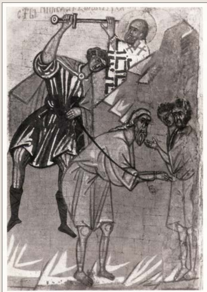
Святитель Николай Чудотворец спасает от казни трех невинно осужденных мужей. Клеймо житийной иконы (XV век). Дмитровский краеведческий музей

Сегодня вопрос смертной казни — один из самых обсуждаемых. На эту тему ведут дискуссии политики и рядовые граждане, преступники и законодатели, верующие различных религий и атеисты. Многие государства отменили смертную казнь по закону или не осуществляют ее на практике. Помня, что милосердие к падшему человеку всегда предпочтительнее мести, Церковь приветствует такие шаги государственных властей. Вместе с тем она признает, что вопрос об отмене или неприменении смертной казни должен решаться обществом свободно, с учетом состояния в нем преступности, правоохранительной и судебной систем, а наипаче соображений охраны жизни благонамеренных членов общества.