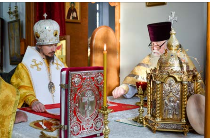
На фото: За Литургией в Воскресенском кафедральном соборе города Борисова. 23 октября 2014 г.

собора, архиепископ Гурий подарил список иконы Божией Матери «Жировичская».